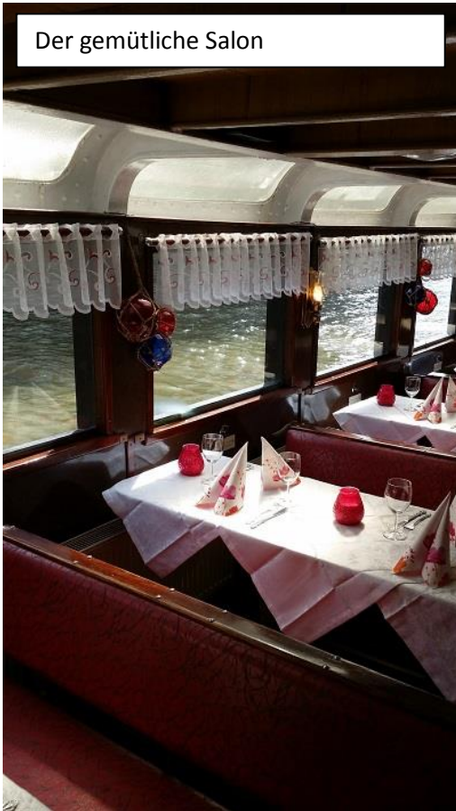
Der gemütliche Salon